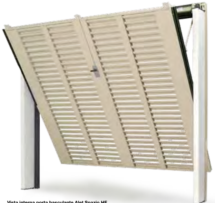
Vista interna porta basculante Alet Spazio HF, tinta Ral 1015 (optional). Le foderine copripeso sono in lamiera preverniciata bianca simil Ral 9016.