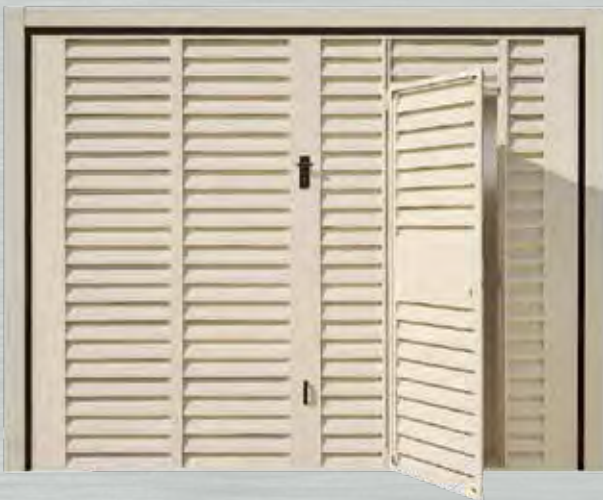
Vista esterna porta basculante Alet Sikura HF con porta pedonale alettata integrata nell'anta mobile. La porta pedonale la tinta Ral 1015 e la maniglia in abs sono optional.