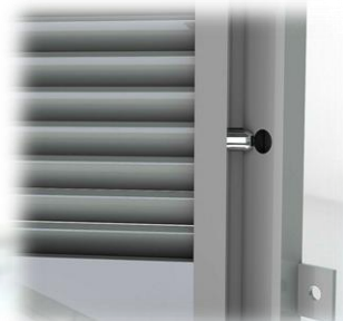
Particolare dei tondi in acciaio inox aisi 304 antistrappamento delle alette